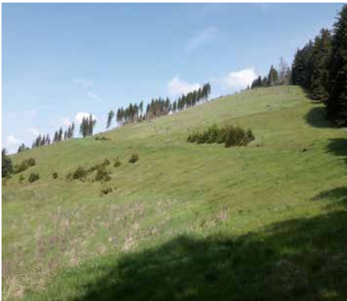
Blick auf die Almweide vlg. Abraham, Walzkogel