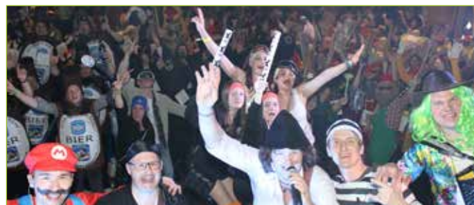
Partylaune beim Maskenball mit den Krochledern