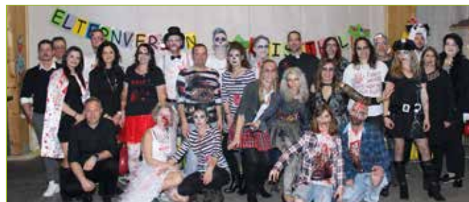
Nach 2-jähriger Zwangspause meldeten wir uns als „Zombies“ zurück.