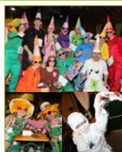
Wir freuen uns auf viele tolle Verkleidungen im nächsten Jahr.