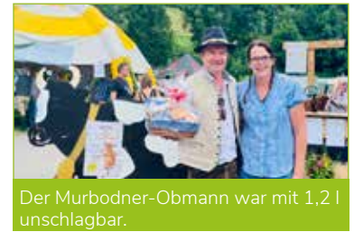
Der Murbodner-Obmann war mit 1,2 l unschlagbar.