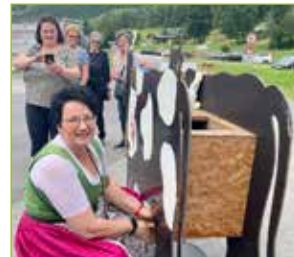
Beim Dorfkirtag suchten wir den Melk-Champion. Auch unsere Bürgermeisterin versuchte ihr Glück.