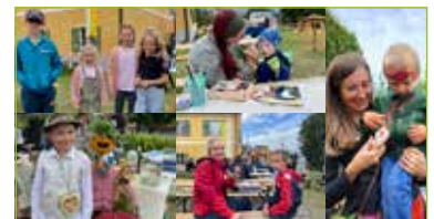
Für die Kinder gab es Marshmallows und Kinderschminken.