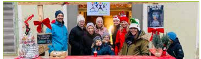
Beim Krampuslauf war unser Kakao heiß begehrt.