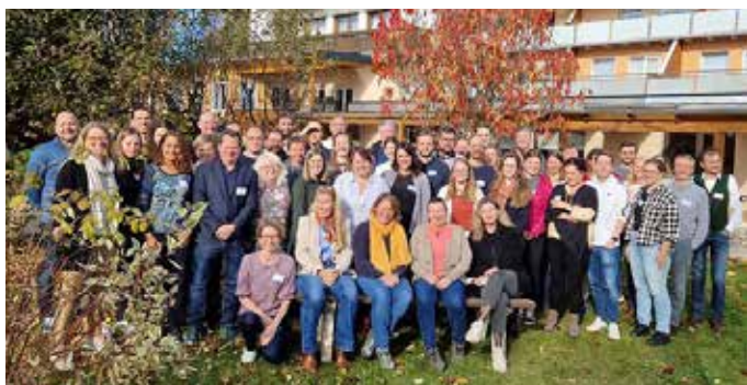
KLAR! Fachveranstaltung in Semriach

Im Rahmen des KLAR! Programms treffen sich die KLAR! Manager:innen von ganz Österreich drei Mal jährlich zu fachspezifischen Schulungs- und Vernetzungstreffen des Klima- und Energiefonds, die von der Umweltbundesamt GmbH organisiert werden. Eine der KLAR! Fachveranstaltungen in diesem Jahr hat die Teilnehmer:innen am 15. und 16. November nach Semriach geführt.