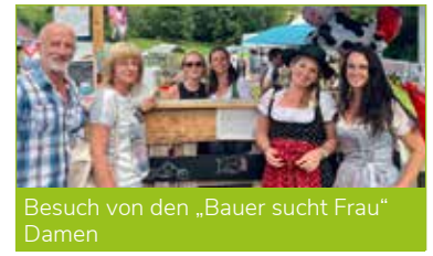
Besuch von den „Bauer sucht Frau“ Damen