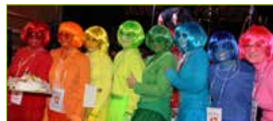
Der „alte“ Elternverein machte farbenfroh als Regenbogen Stimmung.