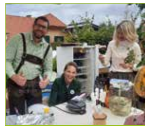
Ein bisschen Spaß muss sein