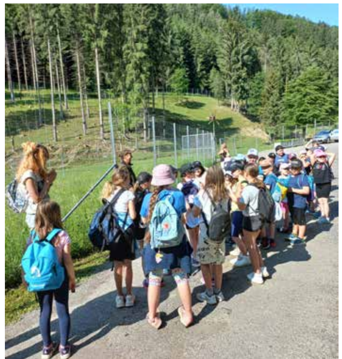
Wandertag mit den Volksschul-kindern zum Ambrosbauer