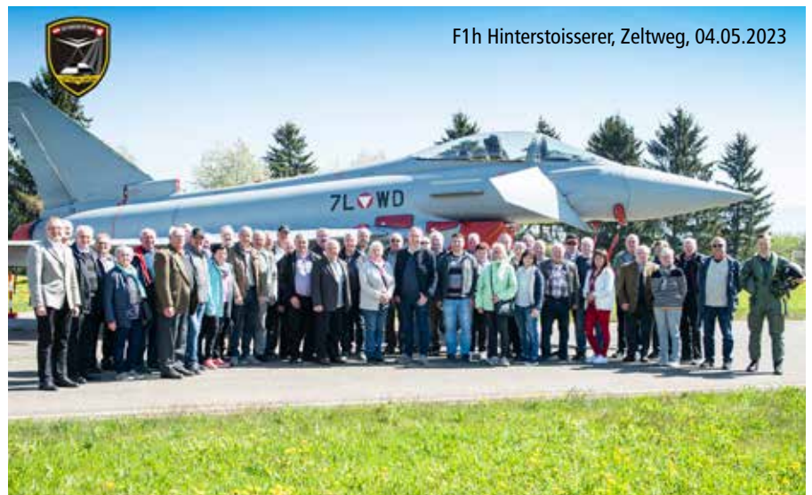
F1h Hinterstoisserer, Zeltweg, 04.05.2023