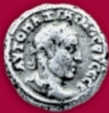
Silbermünze des Kaisers Maximian Thrax, aus Afling, 235-238 n. Chr.