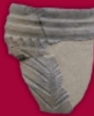
Bruckstücke von einem verzierten Gefäß aus Keramik, späte Latènezeit, 2./1. Jh. v. Chr.