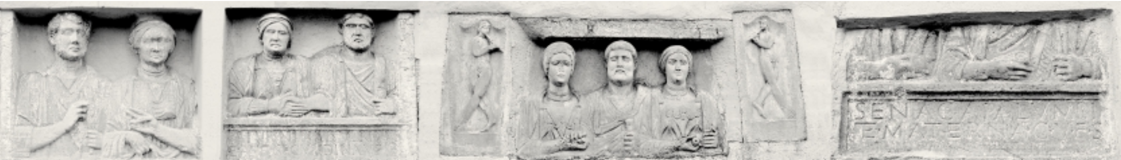
1. Grabstein mit Porträts; 2. Grabstein des Saturninus Verinus und seiner Frau Aurelia Secundina; 3. Grabstein mit Porträts. Grabbauteile: Satyrn mit Doppelflöten; 4. Grabstein (mit Porträts) des Seneca und seiner Frau Materna; (alle Pfarrkirche Stallhofen).