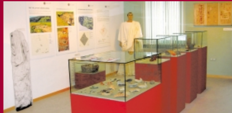
Blick in das Kelten- und Römermuseum

Rechts: Römer in offiziellem Bürgergewand.